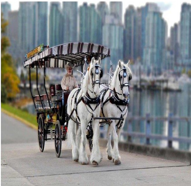
斯坦利公園馬車巡遊